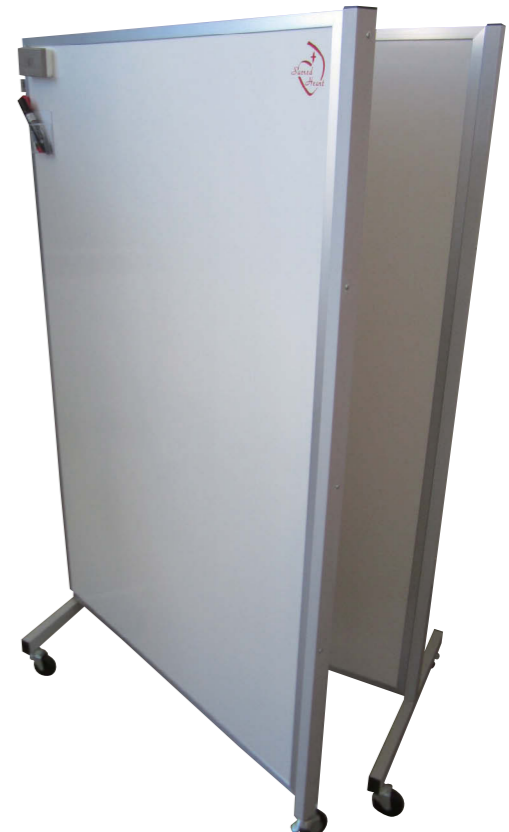
2連折りたたみ式両面ホワイトボード 別色脚付 (ロゴマーク入り)