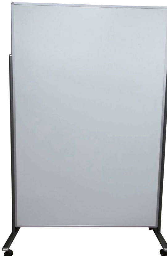
片面ホワイトボード フリーサイズ脚付