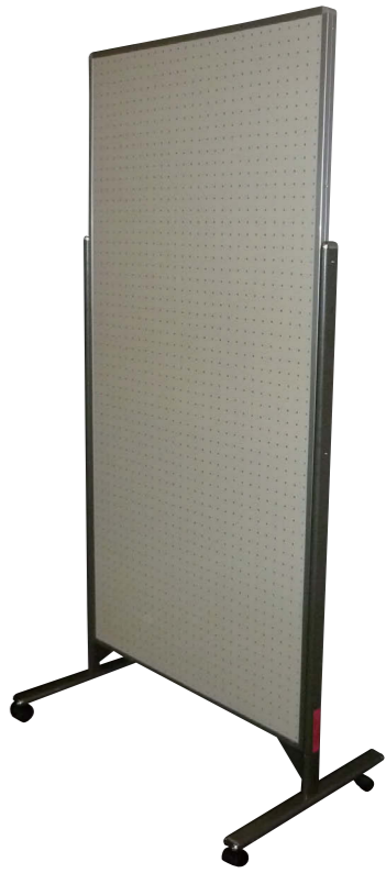
片面有孔ボード/片面掲示板 フリーサイズ脚付